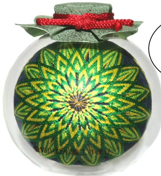
滋賀県伝統的工芸品 「愛知川びん細工手まり」(イメージ)

ガラスびんの中に美しい手まりを閉じ込めた、滋賀県伝統的工芸品「愛知川びん細工手まり」。「愛荘町ふるさと体験塾 neo」では、愛知川びん細工手まりの制作体験を通して愛荘町の歴史・文化にふれていただけます。