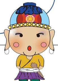
愛荘町イメージキャラクターあししょうざん

<参加決定のご連絡・確定> 9月中旬までに電話もしくは郵送でご連絡します。指定期日までに指定口座へ参加費をご入金ください(振込手数料はご負担願います)。入金確認後、参加確定となります。