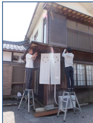
アートで中山道愛知川宿をにぎやかに！

<参加賞あり> 特選、準特選、入選、中学生の部、キッズの部(小学生以下)、特別賞など各賞もご用意