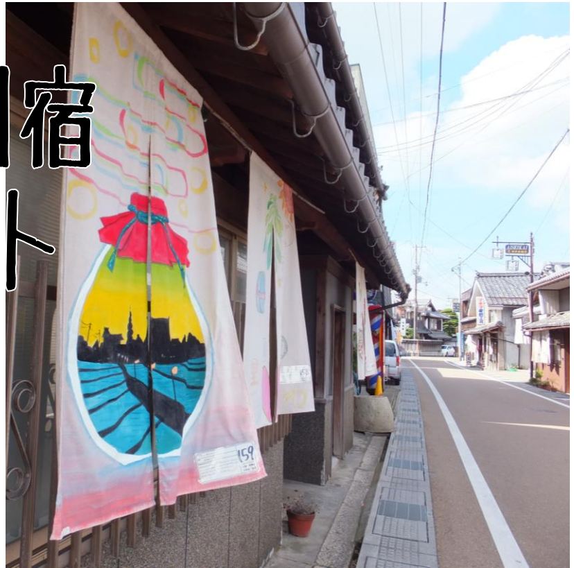
まちなみが明るくなりますように！（過去の展示風景）